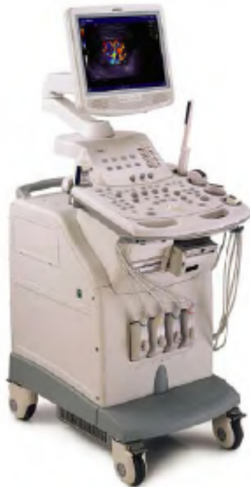
DC-6 Expert Diagnostic Ultrasound System

pulso); Múltiplas zonas focais; Conexão para 4 transdutores; THI: Imagem harmônica de tecido; Angulação – Steer (para os modos B, Color, Power, PW); Transdutores multifrequênciais selecionáveis via Painel de Controle.